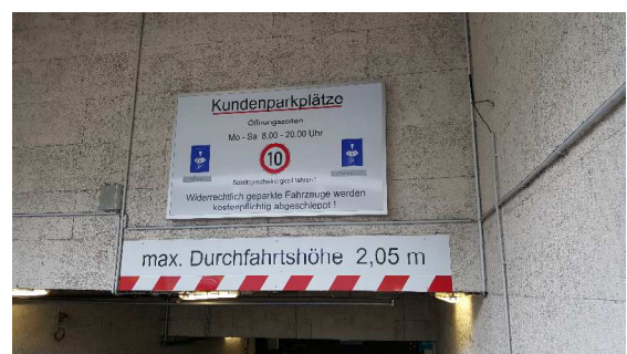
Abbildung 1: Tiefgarage City Center 2