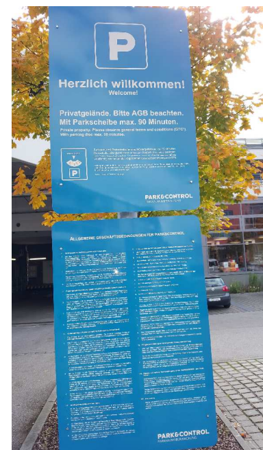
Abbildung 3: Hasi & Biomarkt