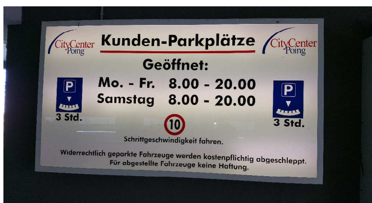
Abbildung 2: Parkhaus City Center